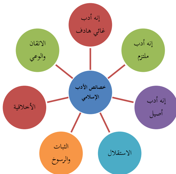
Rajah 2: Peta Buih tentang Ciri Kesusasteraan Islam

Rajah tersebut adalah tentang peta buih yang menjelaskan ciri kesusasteraan Islam. Topik utama peta tersebut ditulis pada bulatan tengah; iaitu الإسلامي خصائص الأدب (Ciri-ciri kesusasteraan Islam), manakala keterangan untuk topik tersebut ditulis pada bulatan-bulatan di sekelilingnya. Peta Buih ini digunakan untuk menjelaskan kualiti atau ciri benda, objek atau perkara dan lain-lain. (Faridah et al: 2016).