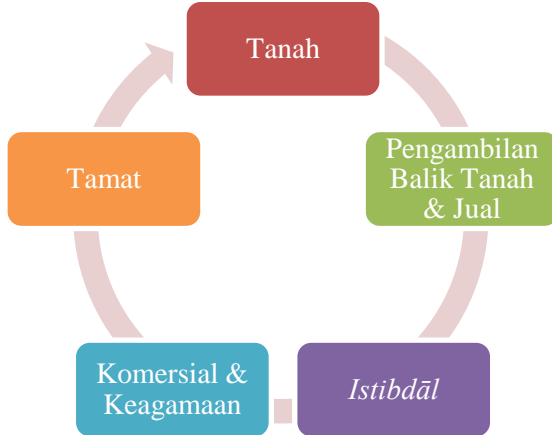
Rajah 1: Konsep Pelaksanaan Istibdāl

bersifat kekal sama ada tanah atau bangunan (JAWHAR, 2010). Konsep istibdāl yang telah dilaksanakan di peringkat MAIN sebagai mana rajah di bawah: